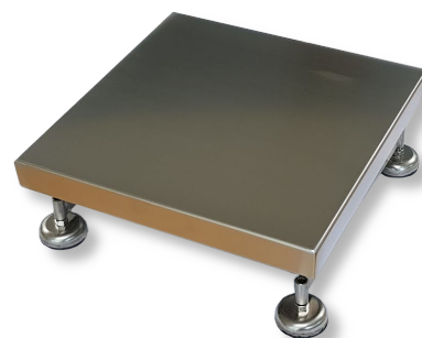
* BSS - B250x250-3

Modell A/B är en robust industrivåg med kapacitet för, 3kg, 10kg, 15kg, 30kg, 60kg, 150kg eller 300kg. Vågen har utvecklats speciellt för att tåla tuff industri-miljö med inbyggda överlastskydd och transportsäkringar. Den centralt placerade lastcellen omges av en pulverlackerad stålkonstruktion. Ovanpå ligger belastningsplattan som är tillverkad i rostfritt stål med nervikta kanter. Vågen har justerbara fötter. Levereras vågen tillsammans med våginstrument medföljer kalibreringsprotokoll utförd med spårbara vikter.